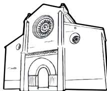
Iglesia de San Miguel