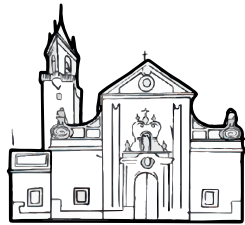
Iglesia de San Andrés