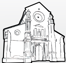
Iglesia de San Pedro