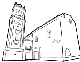
Iglesia de Santo Domingo de Silos