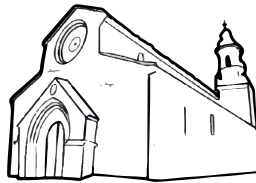
Iglesia de la Magdalena