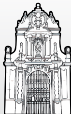
Iglesia de San Pablo