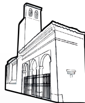
Iglesia de Santiago