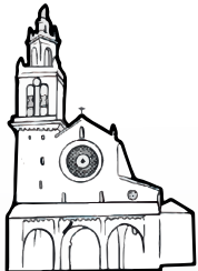
Iglesia de San Lorenzo