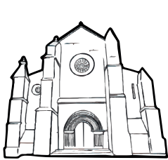
Iglesia de Santa Marina