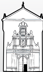
Iglesia de San Fco. y San Eulogio de la Axerquía